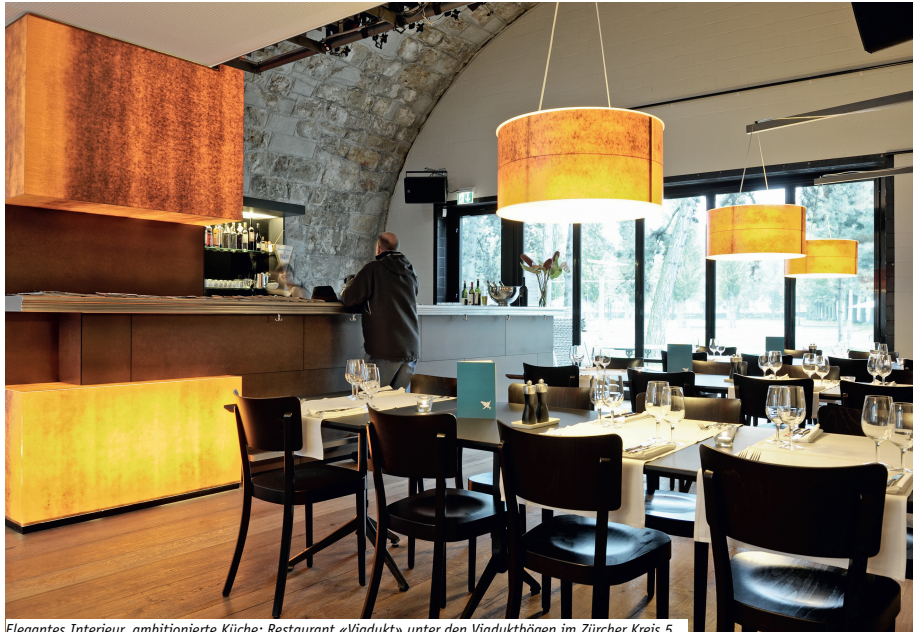
Elegantes Interieur, ambitionierte Küche: Restaurant «Viadukt» unter den Viaduktbögen im Zürcher Kreis 5.