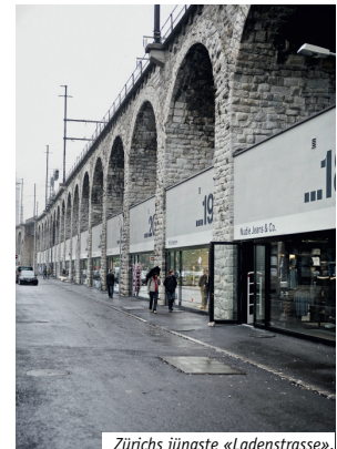
Zürichs jüngste «Ladenstrasse».