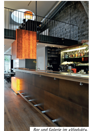
Bar und Galerie im «Viadukt».